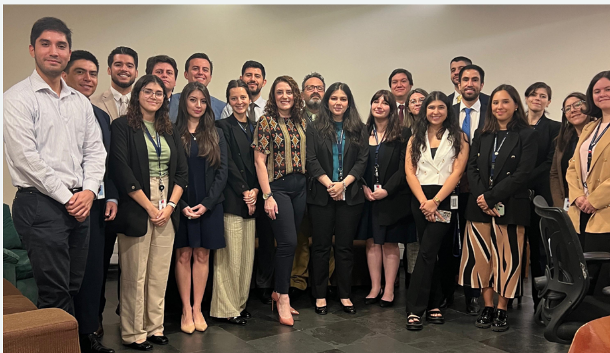
Clase a estudiantes de la Academia Diplomática de Chile Andrés Bello sobre Conducta Empresarial Responsable y Anticorrupción en 2024

Este desempeño refleja la mayor consolidación, proactividad, prestigio y visibilidad del PNC como un activo y reconocido actor en la promoción de la CER, tanto a nivel nacional como internacional. Gracias a esto, su despliegue promocional se ha visto impulsado con el apoyo y fortalecimiento de aliados institucionales, que han facilitado el trabajo colaborativo, tanto en el desarrollo de recursos (guías, políticas nacionales, etc.) como en la realización de variados encuentros.