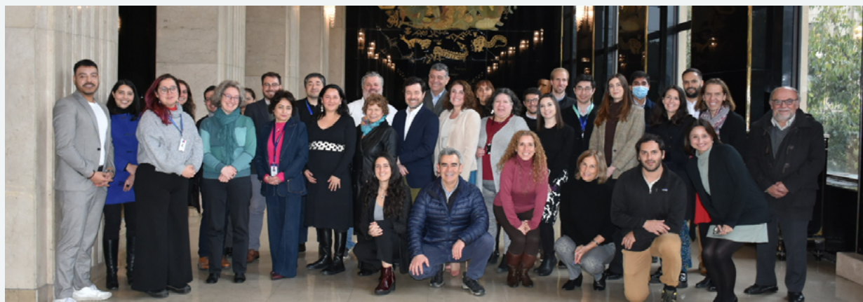
Reunión conjunta 2024 de Comités asesores del Punto Nacional de Contacto de Chile para la Conducta Empresarial Responsable

Fortalezas: Se reconoce una evolución positiva del PNC en cuanto a su visión y misión, junto con una mayor visibilidad y reconocimiento derivados de su creciente actividad y una comunicación más clara y constante con las contrapartes. Se valora la solidez de su mecanismo de resolución de conflictos y la experiencia acumulada en su implementación. El PNC se ha consolidado como una instancia técnica de referencia al promover la CER con un enfoque integral, incorporando instrumentos internacionales como los Principios Rectores sobre Empresas y Derechos Humanos, y contando con un equipo técnico preparado y respaldado institucionalmente por la SUBREI. Asimismo, se destaca su capacidad de convocatoria y articulación intersectorial, así como su activa colaboración multisectorial en el marco de la Red Global de PNC. Se reconoce también su esfuerzo por incorporar progresivamente enfoques diferenciados para abordar los impactos de la actividad empresarial en distintos grupos de la población, junto con la difusión de buenas prácticas y la integración paulatina del enfoque de derechos humanos en sus actividades.