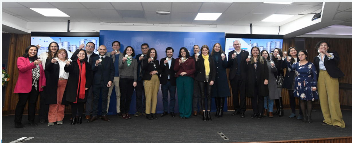
Ceremonia de firma del II Acuerdo de Producción Limpia del Sector Industria Láctea Procesadora Sustentable Programa Chile Origen Consciente del 20 de agosto de 2024

co-privadas, y organizaciones sindicales. Lo anterior refleja el creciente interés y reconocimiento de diversos actores respecto al valor que atribuyen a la participación del PNC en sus agendas y proyectos.