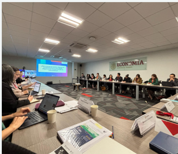
Encuentro de aprendizaje entre pares 2025 del Subgrupo de Conducta Empresarial Responsable de la Alianza del Pacífico en Ciudad de México, México “Involucramiento del Punto Nacional de Contacto con sus grupos de interés y fortalecimiento como mecanismo no judicial de solución de conflictos