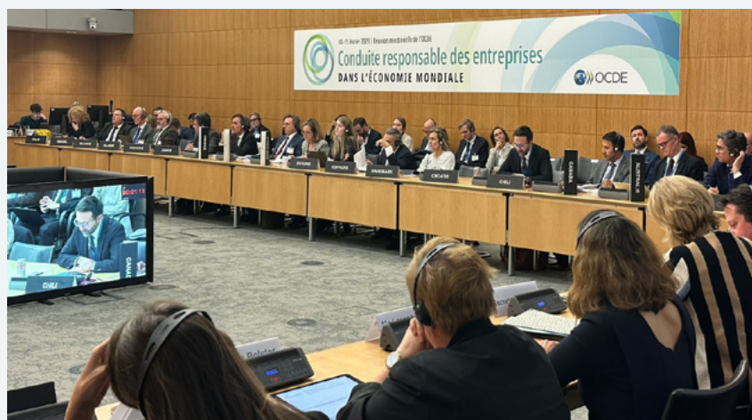
Discurso de Francisco Saffie, Embajador de Chile ante la OCDE, en la Ministerial de la OCDE sobre Conducta Empresarial Responsable 2023

La Cumbre Ministerial concluyó con dos productos principales: (1) la Declaración sobre la promoción y facilitación de la conducta empresarial responsable en la economía mundial ; y (2) la Recomendación sobre el papel del gobierno en la promoción de la conducta empresarial responsable .