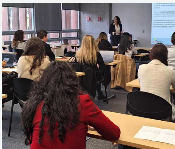
Encuentro de aprendizaje entre pares SG-CER-AP “La Conducta empresarial responsable: el rol de los Puntos Nacionales de Contacto” entre el 26 al 28 de agosto de 2024 en Bogotá, Colombia