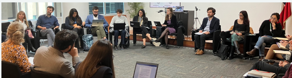
Misión Investigativa de la OCDE 2025 en el marco del desarrollo del Estudio OCDE sobre Conducta Empresarial Responsable en Chile

En cuanto al Estudio, se espera que su versión final sea publicada durante 2026.