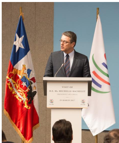
Ginebra, 29 de marzo de 2017