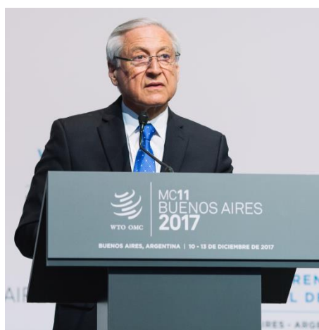
Buenos Aires, 11 de diciembre de 2017

En primer lugar, quiero transmitir a todos Uds. el firme y permanente compromiso de Chile con el sistema multilateral de comercio basado en reglas, que la OMC representa.