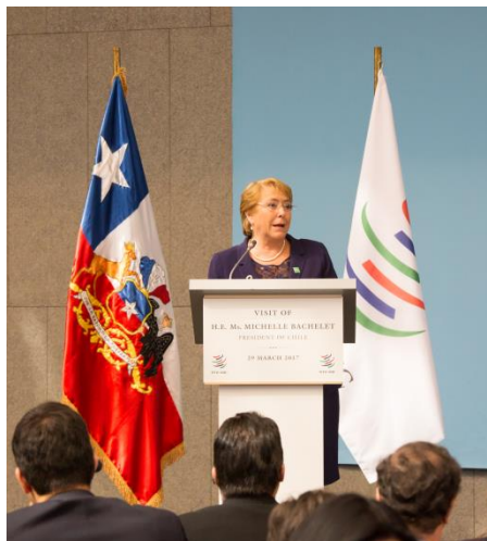
Ginebra, 29 de marzo de 2017